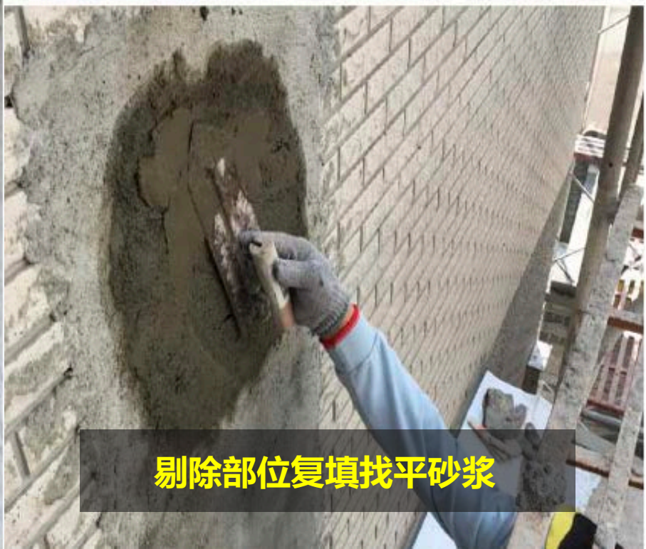
剔除部位复填找平砂浆