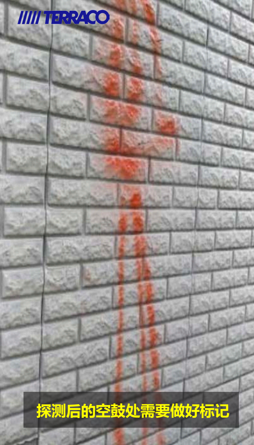
探测后的空鼓处需要做好标记